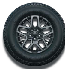
18" polerowane obrzęcze kół w kolorze Tech Grey