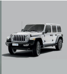
699 Zynith Silver (metalizowany)