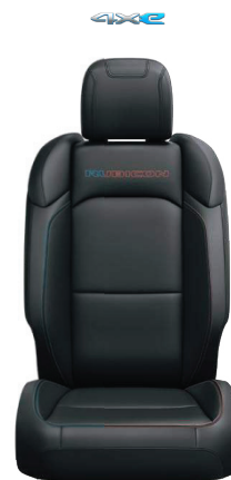
CZARNA TAPICERKA SKÓRZANA RUBICON