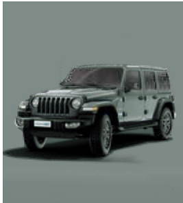
PGP Earl (bezbarwny)