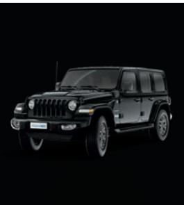
PX8 Black (pastelowy)

Pokazane kolory stanowią jedynie ilustrację i nie odpowiadają rzeczywistym kolorom nadwozia.