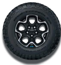
17" lakierowane obrzęcze kół

■ wyposażenie standardowe - wyposażenie niedostępne P pakiet / opcja dostępna w pakiecie