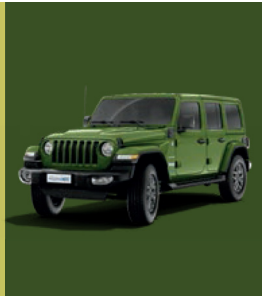
PGG Sarge Green (pastelowy)