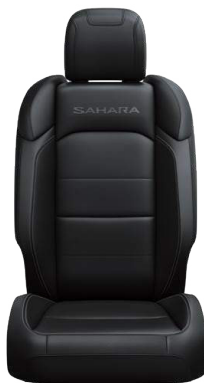
CZARNA TAPICERKA SKÓRZANA SAHARA