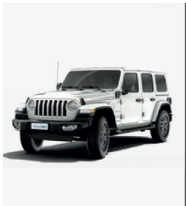
PW7 Bright White (pastelowy)