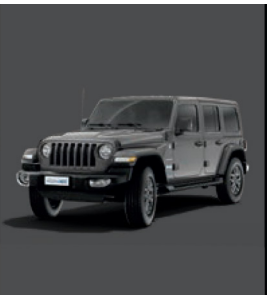
PDN Sting-Gray (pastelowy)