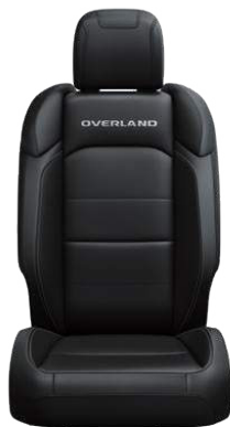
CZARNA TAPICERKA McKinley SAHARA z pakietem Overland