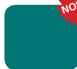
596 Bikini (perłowy)

Pokazane kolory stanowią jedynie ilustrację i nie odpowiadają rzeczywistym kolorom nadwozia.