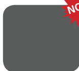
PDS Anvil (pastelowy)