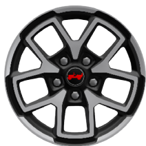
WFV Aluminiowe obręcze kół 17" Rubicon (standard)

■ wyposażenie standardowe - wyposażenie niedostępne