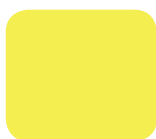
596 High Velocity (pastelowy)