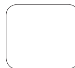
PW7 Bright White (pastelowy)