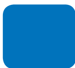
858 Hydro Blue (pastelowy)