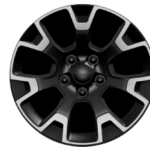
WPD Aluminiowe obręcze kół 18" lakierowane Baltic Gray Sahara (opcja)