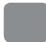
699 Silver Zynith (metalizowany)