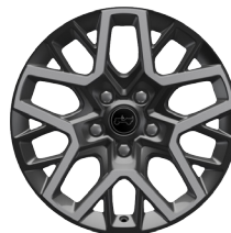
WPA Aluminiowe obręcze kół 18" Sahara (standard)