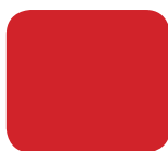
PRC Firecracker Red (pastelowy)