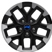
WFE Aluminiowe obręcze kół 17" z wykończeniem Mid-Gloss Rubicon (opcja)